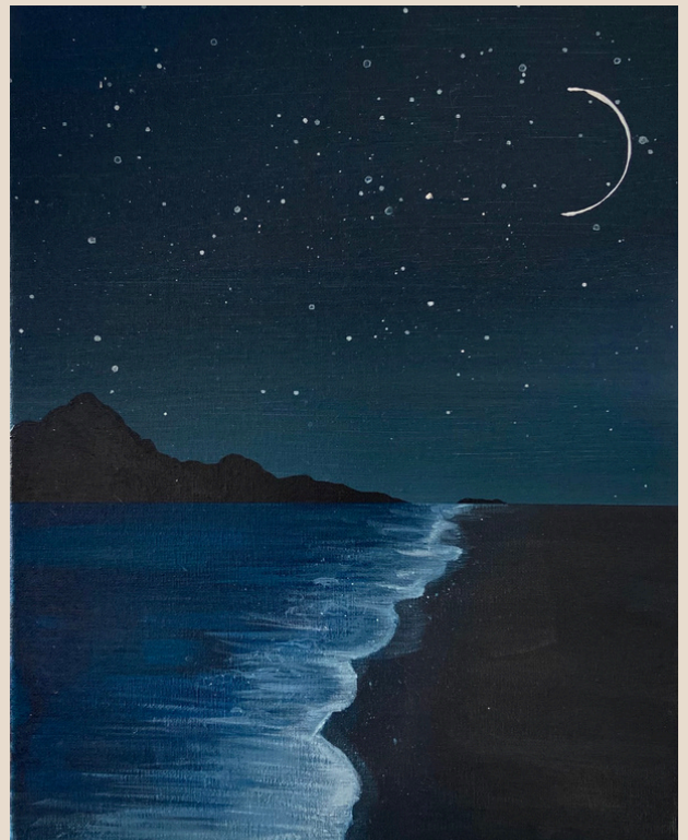
Beach night out