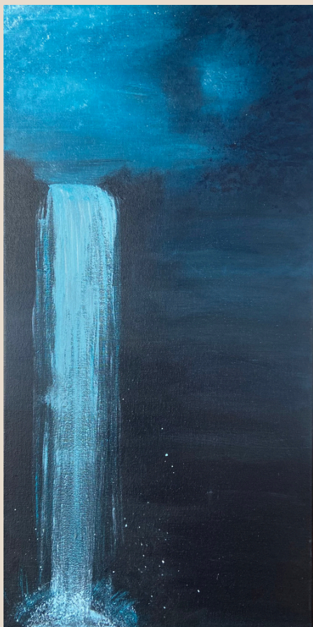
Down the water