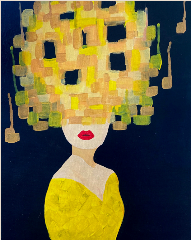
Lady in yellow